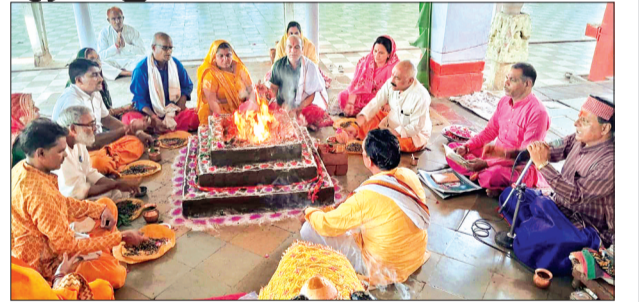
मनकामेश्वर का अभिषेक सुबह 10 बजे प्रारंभ हुआ। वहीं 1 बजे से हवन पूजन प्रारंभ हुआ जो शाम 6.00 बजे तक चलता रहा। रात्रि 7.00 बजे भव्य आरती कर श्रावण मास में प्रतिदिन चलने वाले