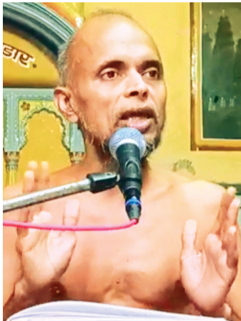
गलती न हो। कोई भी जन्म से कोई कार्य सीखकर नहीं आता है। धीरे-धीरे ही सब सीखाता है। धर्म के बारे में भी कभी-कभी