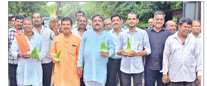
प्रस्तुतियों ने माहौल को आनंदमय बना दिया। गवली यादव समाज के पदाधिकारियों ने जानकारी देते हुए बताया कि भुजरिया पर्व समाज की सांस्कृतिक पहचान है और इसे आने वाली पीढ़ियों तक पहुंचाना हमारी जिम्मेदारी है। अंत में तालाब में भुजरियों का विसर्जन कर उनके तने बड़ों को देखकर उनसे आशीर्वाद लिया और आपस में गले मिलकर सभी ने एक-दूसरे को भुजरिया पर्व की शुभकामनाएं दी। उक्त जानकारी कपिल यादव ने दी।

गवली यादव समाज द्वारा पारंपरिक आस्था और उमंग के साथ भुजरिया पर्व का आयोजन किया गया। इस अवसर पर समाज के सभी वर्गों के लोग बड़ी संख्या में एकत्र हुए और सामूहिक रूप से पर्व की शोभा बढ़ाई। महिलाओं ने भुजरिया की पूजा अर्चना कर सुख-समृद्धि की कामना की। युवाओं और बच्चों में भी खासा उत्साह देखने को मिला। समाज के वरिष्ठजनों ने भुजरिया पर्व के महत्व और सांस्कृतिक धरोहर के संरक्षण की बात कही। कार्यक्रम में समाजजन ने एकता और भाईचारे का संदेश दिया। पारंपरिक गीत-संगीत और नृत्य की